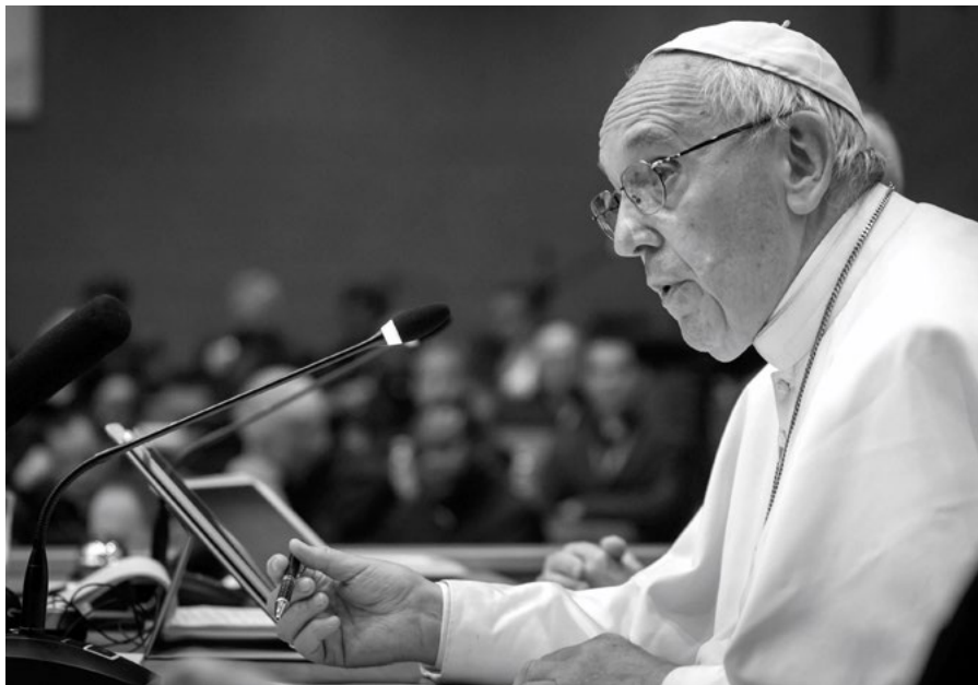
Papež František navštívil jednání 36. generální kongregace Tovaryšstva v roce 2016

Pouze díky kontemplativnímu pohledu na život, kdy si najdeme čas nachezít Boha přítomného a působícího v tomto světě, můžeme plně oceňovat vše kolem nás a s radostí se můžeme snažit, aby byl lepší, než jaký jsme ho obdrželi od svých předků. Dobře to vystihují slova jednoho z odstavců zmíněné encykliky: „Pocit vnitřního spojení s ostatními bytostmi přírody nemůže být autentický, pokud nám v srdci zároveň chybí něha, soucit a starost o druhé lidi. Je evidentní, že není sám se sebou v souladu ten, kdo bojuje proti obchodu se zvířaty, jimž hrozí vyhynutí, ale zůstává lhostejným vůči obchodování s lidmi, nestá-