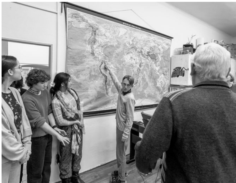
Při návštěvě školy Nativity se otec generál ptal žáků, kde leží jeho rodná Venezuela

patronátu školy nad domovem – v rámci projektu mezigeneračního setkávání naše děti opakovaně navštěvují seniory, klienty domova. Učitelé mezi sebou vybrali kulatou částku finanční pomoci pro rodinu jednoho ze současných žáků, jenž spolu se svými třemi sourozenci zůstal bez maminky, která podlehla agresivní nemoci. Pravidelně, dvakrát do roka, probíhá ve škole „koláčování“, dobročinný jarmark. V každé třídě je alespoň jeden žák, který vyžaduje pomoc asistenta. Ani charitní školou dobročinnosti ale Nativity není.