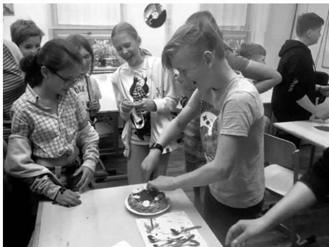
Oslava narozenin se spolužáky

si, že jsem opakovaně blízkým lidem, kolegům a přátelům řekl, že práce pro Nativity je odměnou za vše, čím jsem ve své profesi musel projít a co unést. Někdy jsem s nadsázkou řekl, že Bůh mě má opravdu asi rád, když mě do Nativity přivedl ke konci mé pracovní kariéry. Můj duchovní rozměr a víra se v Nativity rozšířily a prohloubily. Jsem si jistý, že Bůh je na tomto místě trvale ve všem přítomen a je všemu a všem tady na jejich životní cestě a v pracovním snažení ku pomoci.