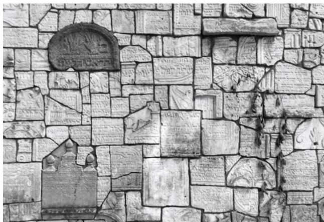
Zed' ze zničených náhrobků na židovském hřbitově Remu, Kazimierz v Krakově

keré následovaly, déle než rok byli obyvatelé Gazy vystaveni nelítostnému ozbrojenému konfliktu, jehož cílem je vymazat všechny stopy po Hamásu. Propalestinské demonstrace a protidemonstrace židovských skupin slouží jako připomínka bolesti a hněvu, který pociťují obě strany. Židé se obávají opakovaného vzestupu antisemitismu a Palestinci si připomínají masové vysídlení po arabsko-izraelské válce v roce 1948. Na jedné straně se opakují slova o bezpečnosti, na straně druhé znějí stesky na projevy nespravedlnosti. Po bolestech holocaustu vzbudilo založení státu Izrael mezi Židy na celém světě pocit národní hrdosti. Útok Hamásu na Izrael dne 7. října, při kterém bylo zabito přibližně 1200 nevinných lidí a zajato 250 rukojmích, byl strašlivým šokem, teroristickým aktem, který žádný stát nemůže akceptovat.