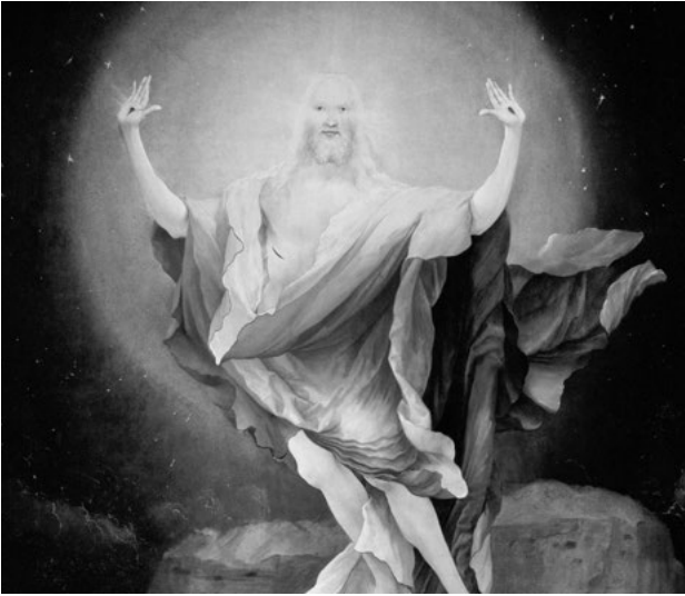
V Kristu je spaseno celé stvoření. Vzkříšený Kristus z Isenheimského oltáře

tedy pouze o spásu duší, ale o vyznání Krista, „skrze něhož a pro něhož bylo všechno stvořeno“ a v němž „všechno trvá“ (Kol 1,16–17).