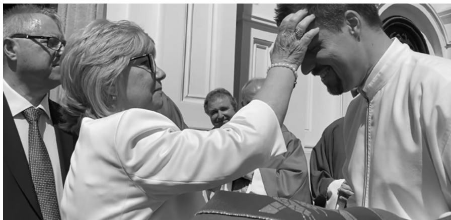
Rodiče žehnají novoknězi před jeho primiční mší v Modre