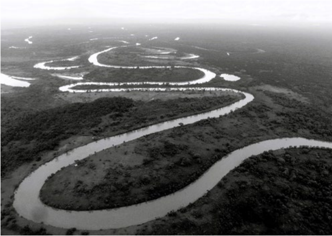
Nelze hlásat evangelium bez ohledu na stvoření. Pohled na rezervaci Río Plátano v Hondurasu

jako možnost, ale jako věrnost svému poslání hlásat Kristovo království až do nitra země.