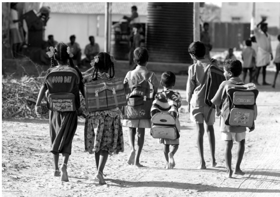
Cítit s církví znamená vnímat potřeby naší doby a s Kristem měnit svět k lepšímu. Děti z rybářské vesnice, kterou zasáhla vlna tsunami, jdou do školy, kterou organizuje JRS v Tamilnádu

ší inspirativní ujištění o vhodnosti „nesouhlasu“ v úsilí „smýšlet“ nebo „cítit“ s církví v novém kontextu: „Nesouhlas je prorocký krok lidí, kteří upřímně milují evangelium a církve, aby nabídli rozumné alternativní způsoby hlásání radostné zvěsti současnému světu.“ Nesouhlas jako způsob smýšlení s církví vypadá jako protiklad Ignácových pravidel pro jeho dobu. Zdá se, že Ignác vnímal, že církev potřebuje větší souhlas s několika rysy římskokatolického života a praxe, které byly ohroženy. Někteří komentátoři se však shodují, že pravidlo 13 (bílé je černé) bylo ve skutečnosti