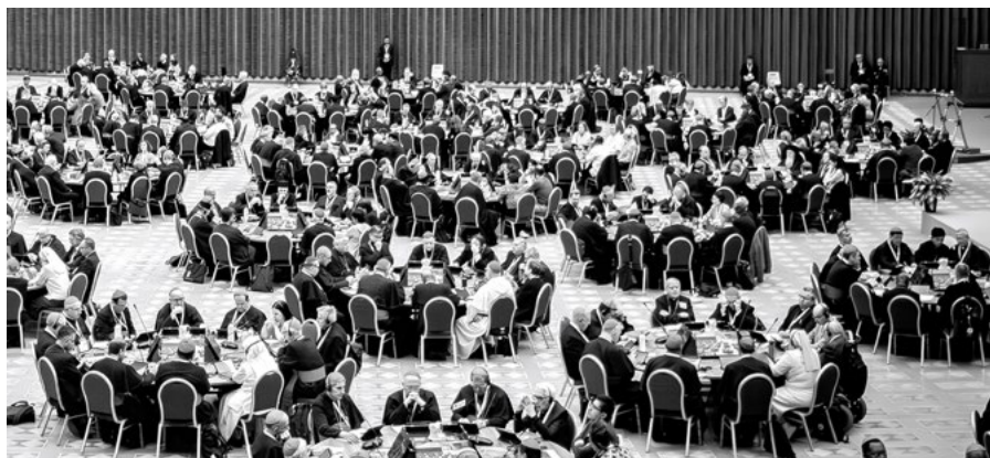
Z druhého zasedání Synody o synodalitě v Římě, 2024

Napětí mezi „kapilárními“ společenstvími a univerzálními strukturami církve bude vždy. Je třeba toto napětí uchovat: když bude vše jen univerzální, rozmanitost bude sežehnuta žářem jednoty, jak píše Johann Adam Möhler již na začátku 19. století. A pokračuje: když se vše bude řídit jen místními společenstvími, celá církev v rozmanitosti ztratí vřelost a zmrzne. Jen Kristus umí udržet dostatečnou vřelost v rozmanitosti.