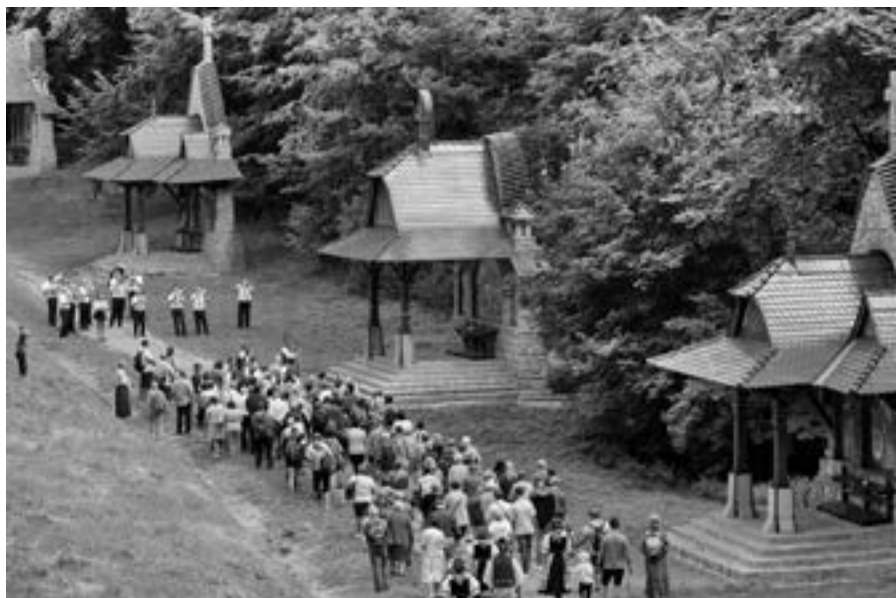
Mnozí poutníci přicházejí na Hostýn pomodlit se u zastavení Jurkovičovy křížové cesty

vou obnovu Jurkovičovy křížové cesty, kterou jsme vlastně dokončili až v letošním roce. Poté již s P. Šolcem jsem se pustili do nesmírně náročné výměny dlažby v bazilice, včetně podlahového topení, a hned potom jsme nechali zhotovit novou zvonovou soupravu s osmi zvony. A následovala oprava a zhotovení podlahového topení v kapli sv. Jana Sarkandra a Panny Marie plačící.