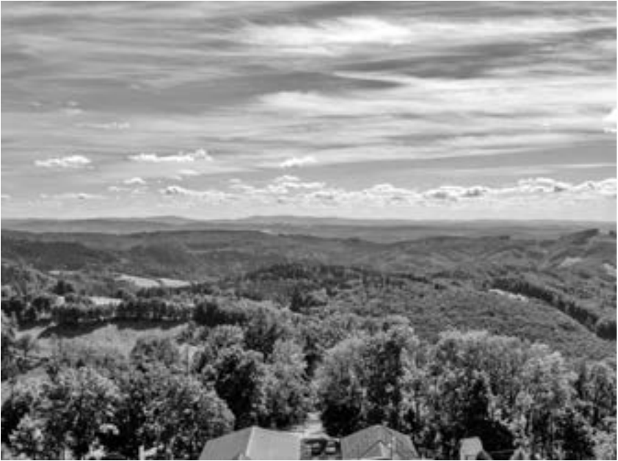
Udělejme si čas vyjít do přírody a jen tak vnímat rozmanitost stvoření. Pohled na Hostýnské vrchy z kupole baziliky

rost je i v tom, že něco začne dělat, ale ve správnou chvíli s tím dokáže přestat. Dokážeme i my na nějakou chvíli přestat, udělat si čas a uvážit, co dál? Nestěžujeme si, že je naše sekera tupá, protože si neuděláme čas na to ji nabrousit? Nepovažujeme se za tak důležité, že musíme být „vždy na lince“? Hospodin dává Adamovi a Evě svobodu a prostor. Dokážeme my dát druhým svobodu růst, byť za cenu chyb?