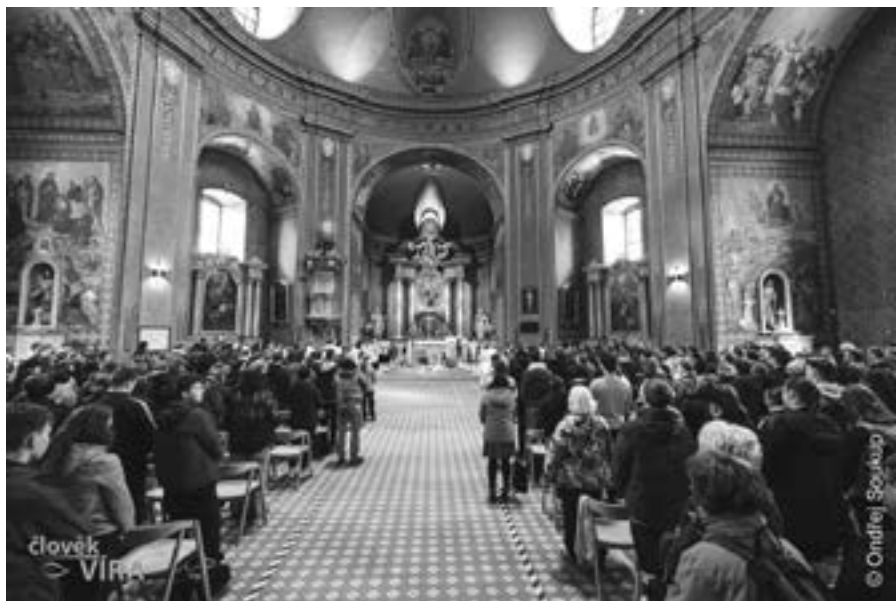
Hostýnská bazilika zaplněná poutníky je povzbudivým obrazem společenství církve