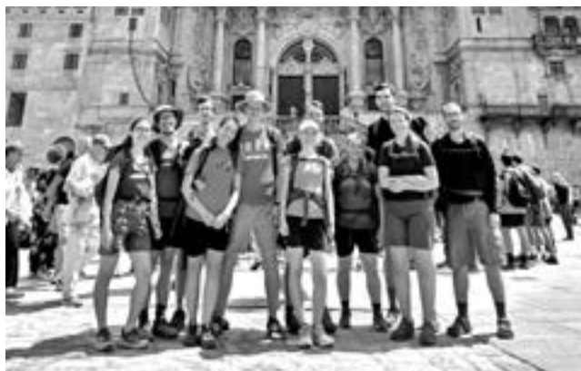
Poutníci v cíli cesty před bazilikou sv. Jakuba

rozdá text, nad kterým budeme následující hodinu v tichosti meditovat. Je to úvod 12. kapitoly knihy Genesis, kde Hospodin vyzývá Abráma, aby se vydal na cestu. Vyjdi ze své země... Naše první albergue vypadá zvenku jako menší zámek a zevnitř jako galerie moderního umění. Vyklusávací procházka podél oceánu, společnými silami připravená obědovečeře, sprcha, první praní v umyvadle a spát.